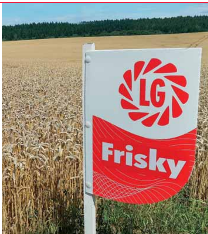
Frisky stojí jako hřebíky

Zdroj: Výsledky z demonstračních pokusů a běžných pěstebních ploch v roce 2020