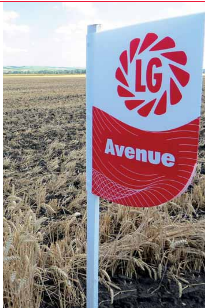
Avenue → nejspanější odrůda v sortimentu

Avenue metá i dozrává společně se středně ranými odrůdami ozimého ječmene. Ve státních odrůdových zkouškách ÚKSÚP byla Avenue o 3 dny ranější než odrůda Košútka. Díky své ranosti jde o optimální předplodinu pro řepku nebo pro zásev letní meziplodiny v rámci „greening“ se zásevem do 31. 7. Vzhledem k ranosti je Avenue potřeba hnojit i ošetřovat včas . Díky své ranosti zpravidla utěče letnímu suchu.