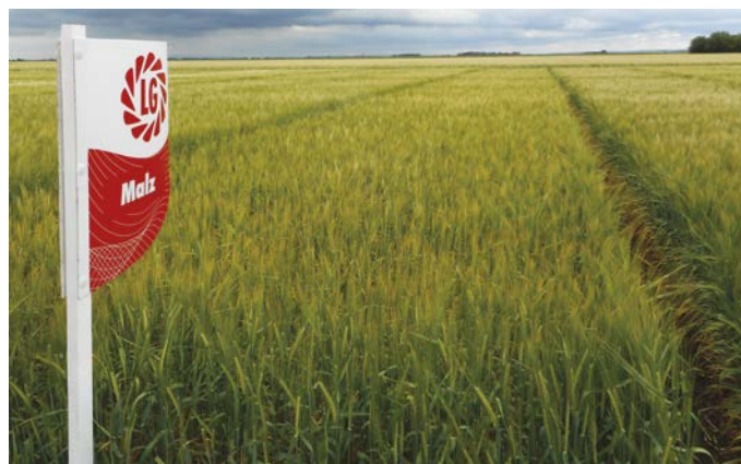
Malz v Hrubčicích

Exportní komodita: Německo, Slovensko, Polsko, Rakousko.