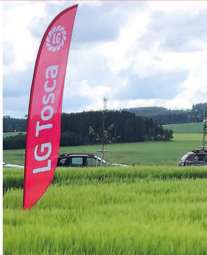
LG Tosca na polním dni v Družstvu Vysočina (okres Jihlava), 2020